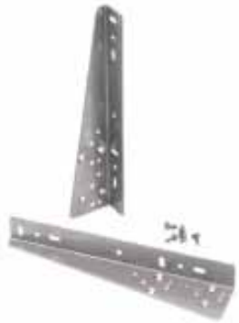
Escuadras para frente de cajón incluidas